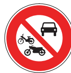
Panneau de signalisation interdisant l'accès à tous les véhicules à moteur

Des contrôles sont réalisés très régulièrement dans le département des Vosges. Les contrevenants s'exposent à de lourdes amendes (1500€) ainsi qu'à l'immobilisation ou à la mise en fourrière de leur véhicule.