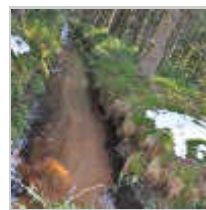
un cours d'eau tracé à la pelleuse, qui ne permet plus le filtrage naturel.