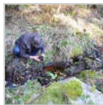
Une couleur rougeâtre douteuse