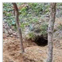
repérer le terrier pour le surveiller.