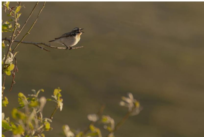
Tarier des prés