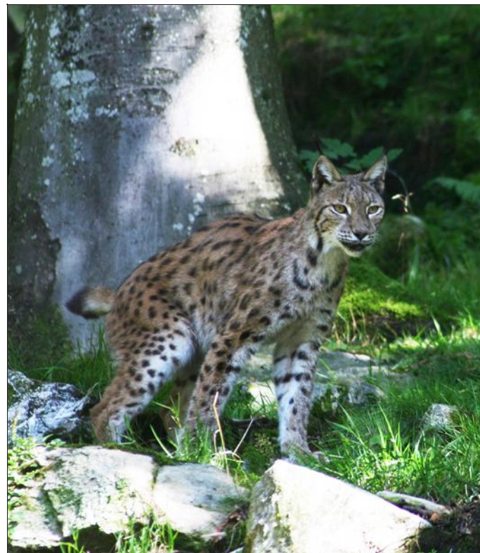
Quatre individus ont été observés ces dernières années dans le massif vosgien, tous mâles. Pas de quoi assurer la survie de l'espèce.

« Les mâles ont une capacité de dispersion plus importante que les femelles, ce qui expliquerait l'absence de celles-ci dans les Vosges », explique l'expert. « Une solution pourrait être de relâcher ici des lynx jurassiens blessés res-