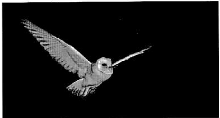
Une silhouette fantomatique...