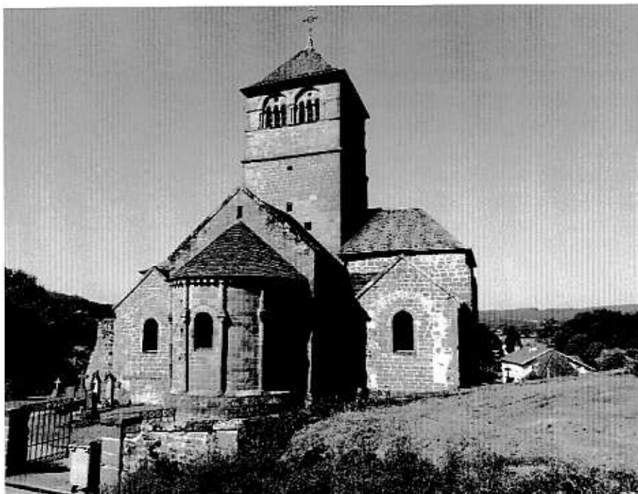
Un nichoir a été installé dans le clocher de Champ-le-Duc