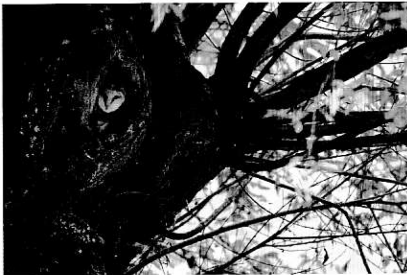
L'effraie utilise parfois des cavités naturelles

Au Moyen Âge, notre chouette, favorisée par l'essor de l'agriculture, s'est répandue dans toute l'Europe occidentale et au-delà. Avant, elle était plutôt confinée dans les régions méridionales, mais l'Homme, en ouvrant les paysages, lui a offert des territoires nouveaux. Pendant des siècles, les activités humaines ont constitué une aubaine 3 pour l'effraie.