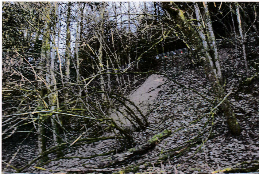
Des terriers imposants en aval de la route !

En 2011, nous avons déjà conseillé la commune pour des travaux de réfection superficiels (remblais) à cet endroit.