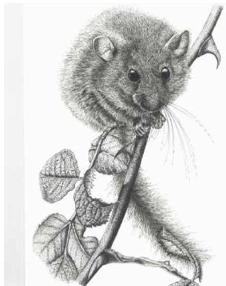
Le muscardin, hôte si discret des haies...