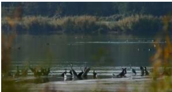
Rives de la Moselle

Renseignements au 03.29.38.18.70 ou cpn.ptitscastors@free.fr