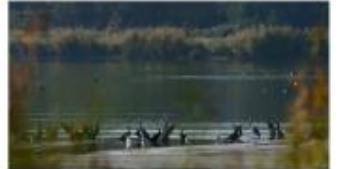
River de la Moselle

Le sentier pédagogique de la Réserve Naturelle Régionale de la Moselle Sauvage Région : Normandie métropolitaine 2020 Sorties-voies : le samedi 27 mars 2021 à 9h au point de Druon des Hautes-Montagnes. Départ : 25 98 (arrêt à 12 h 15) Animateur : Bernard Krusek et la CPN - Les P'tits Castors - Renforcements : au 01.29.18.14.78 ou spas.primaires@les.fr