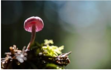
Champignon laccaire-améthyste © Jacques-Martin