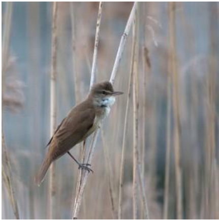
Rousserolle turdoïde