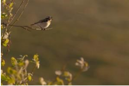
Tarier des prés