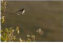
Tourterelle de l'Est

Les prairies du Cal des Hays Région : Normandie métropolitaine 2020 Région : Normandie métropolitaine 2020 Région : Normandie métropolitaine 2020 Région : Normandie métropolitaine 2020 Sorties-voies : dimanche 6 juin 2021 à 9h devant l'église de Houllevent. Animateur : Hervé Bruchon et Yves-Louis Haas. Départ : 15h. À prévoir : une paire de jumelles et des gants.