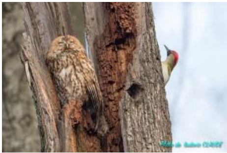
Chouette hulotte et Pic vert