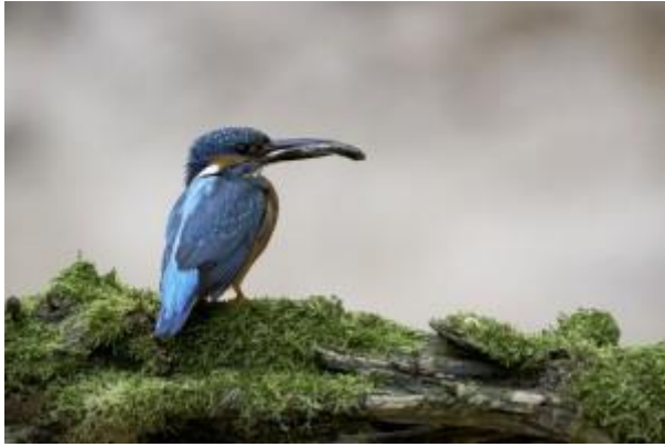
Martin pêcheur