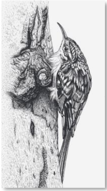
Grimpereau des jardins