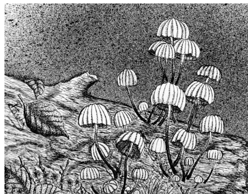
Marasme petite roue

Prévoir aussi un masque et du gel hydroalcoolique.