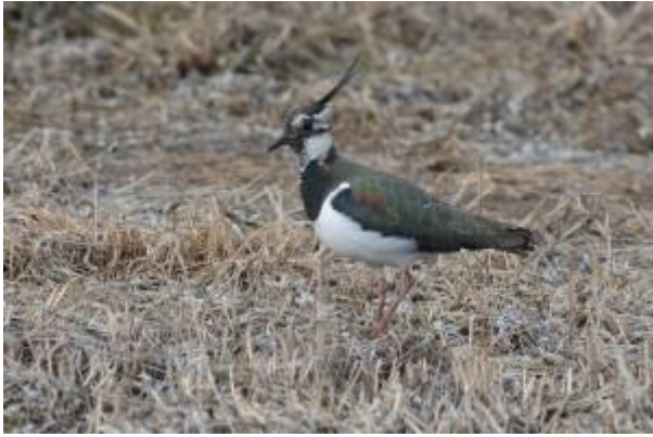
Vanneau huppé

Le CPN les p'tits castors de Charmes a organisé samedi 22 mai 2021 , une sortie : " le vanneau huppé, la Bécassine des marais et l'Alouette des champs , des espèces en fort déclin et pourtant encore chassée".