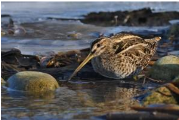
Bécassine des marais

Des oiseaux de plus en plus rares... et pourtant encore chassés !