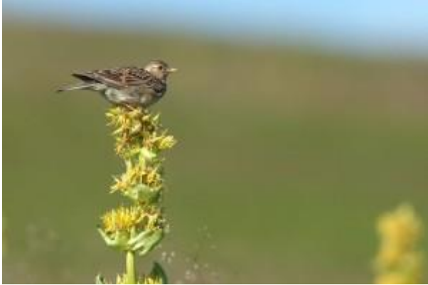
Alouette des champs

Interdiction de la chasse à l'alouette des champs et réduction des périodes de chasse pour le vanneau huppé et la bécassine des marais, grâce à votre mobilisation!