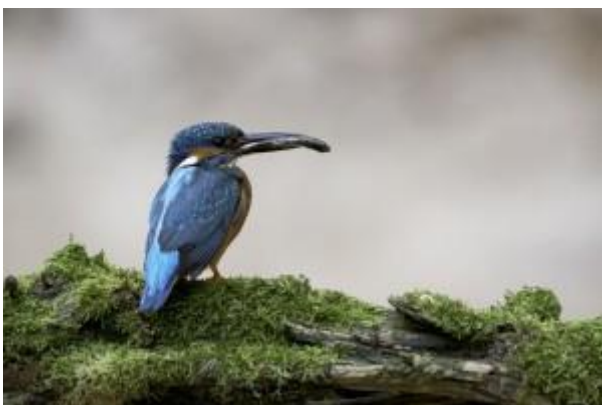
Martin pêcheur