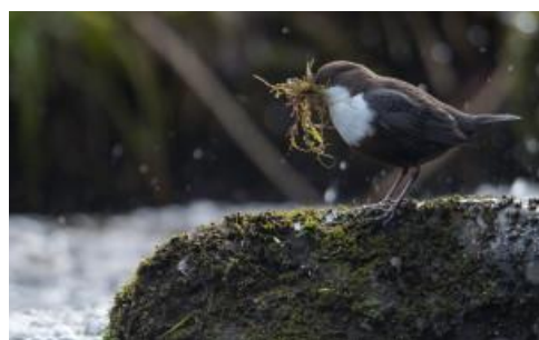
Cincle plongeur

Inscription auprès de Sandrine au 07.68.06.57.69