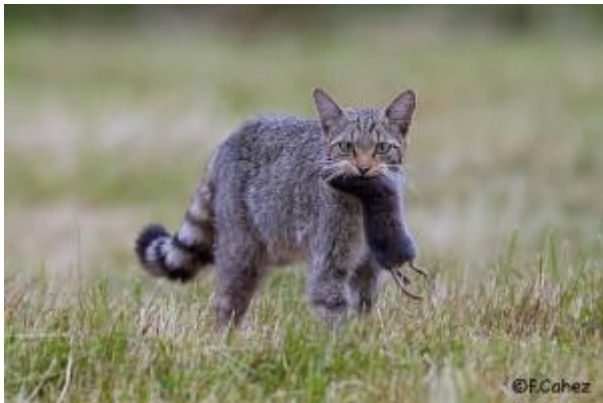
Chat forestier

Le samedi 10 Juin à 10h et exposition photographique à la médiathèque de Xertigny au 2 bis, rue du Commandant Saint Sernin, 88220 Xertigny