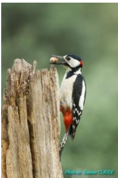
Pic épeiche