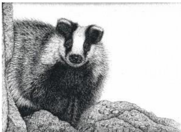
Dessin Catherine Bernardin

Inscription obligatoire pour éviter un trop grand groupe : claudimaurice@hotmail.com