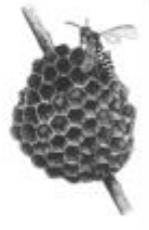
Une petite guêpe de genre Polistes sur son nid