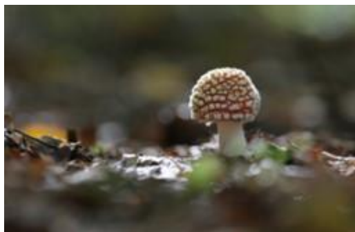
Amanite tue- mouches Photo © Nicolas Héлитas

A prévoir : un panier, un couteau, une loupe de terrain, des bottes ou de bonnes chaussures