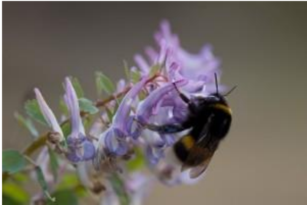
Bourdons et corydale Photo © Nicolas Héлитas