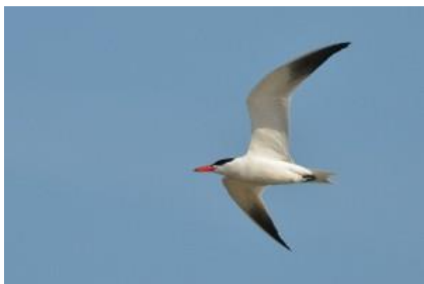
Sterne Caspienne