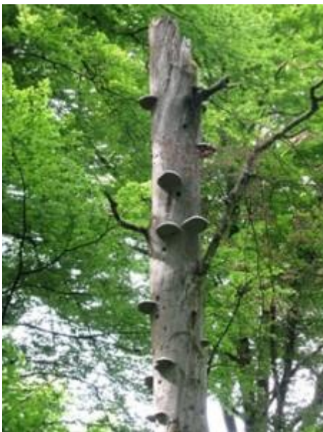
Chandelle de hêtre avec Champignons et cavités – Photo Catherine Bernardin

Contact : Michel DUCHÊNE au 06 80 22 33 63 ou 06 19 92 41 00