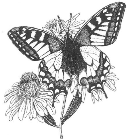
Le Machaon, un papillon facile à identifier !