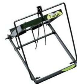
Piège en X ou Connebear