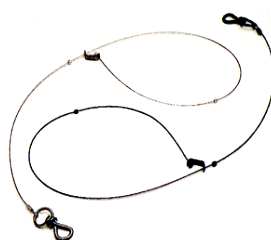
Collet à arrêtoir