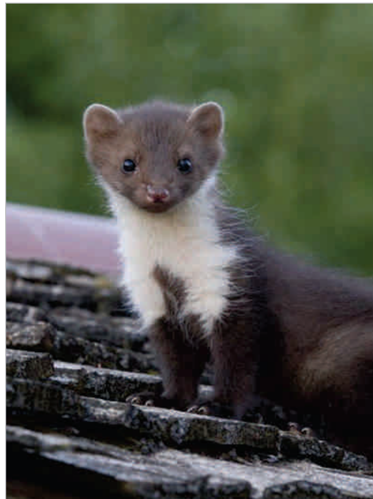
Mignonne à croquer et en même temps si fragile...

Plus d'informations sur le site http://association-oiseaux-nature.wifeo.com ou tel : 03 29 32 72 72.